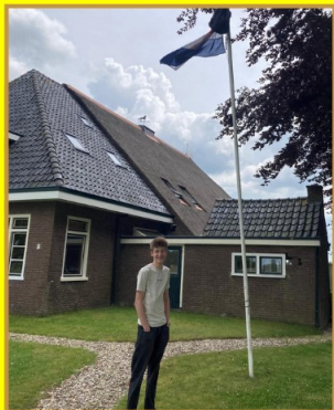
Rutmer Bloemhof Havo