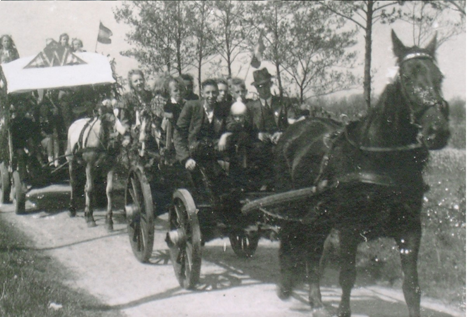
En wiene die feesten dan in pear dagen? Dagen? Wiken hawwe wy feeste! Verschillende mensen die in deze Heidehipper zijn genoemd zijn ook te zien op deze foto.