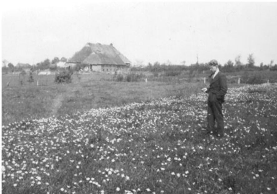
Germ Tjepkema wijst aan waar de vliegenier is neergekomen.

Er is er ook één neergestort op de toenmalige slagerij in Opeinde, dichtbij het kerkhof.