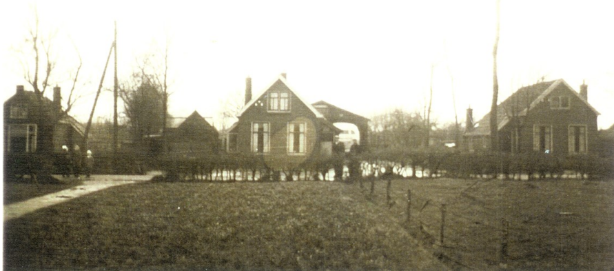
Susterwei 10 en 12